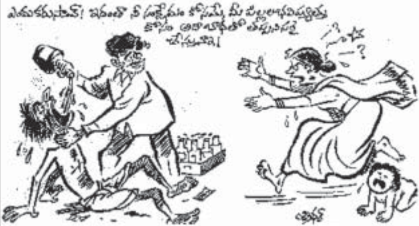
The (then) Chief Minister, Chandra Babu Naidu, is telling the woman, 'Don't cry! I am forced to do this for your welfare and for your children's future! I am doing it with sorrow!'