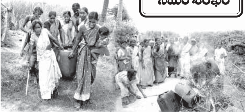
కాకవీడులో నాటుసారా, గుడుంబాలపై కొండు బగించిన